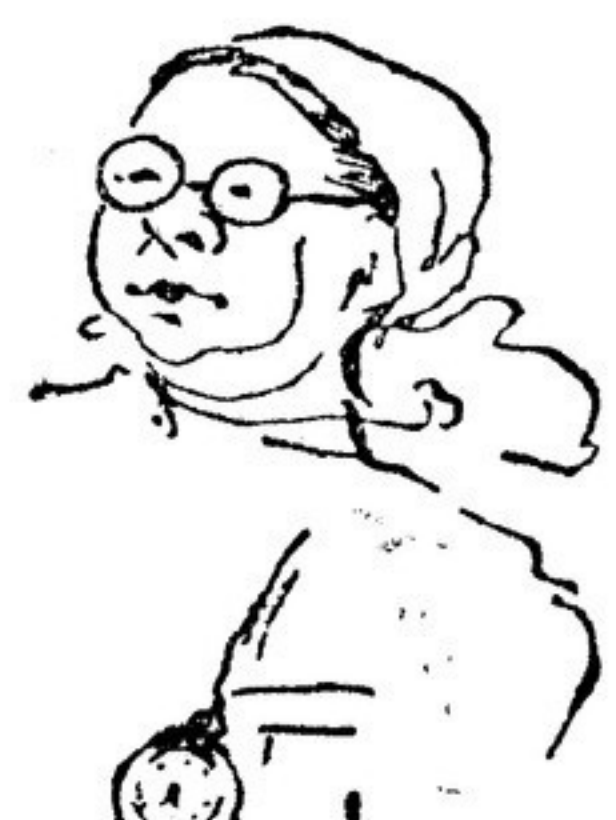
К. Фролова-Агафонова Рис. А. Шабад