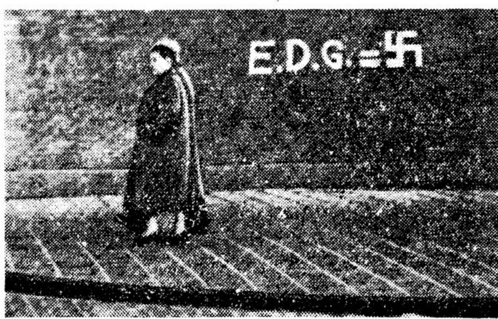
На улице Явстраат в Амстердаме. Надпись, сделанная голландскими сторонниками мира: между буквами E. D. G. — сокращенное название «европейского оборонительного сообщества» — и фашистской свастики они поставили знак равенства. Снимок из голландской газеты «Де ваархейд»

— Нам хотят навязать «европейское оборонительное сообщество» про-