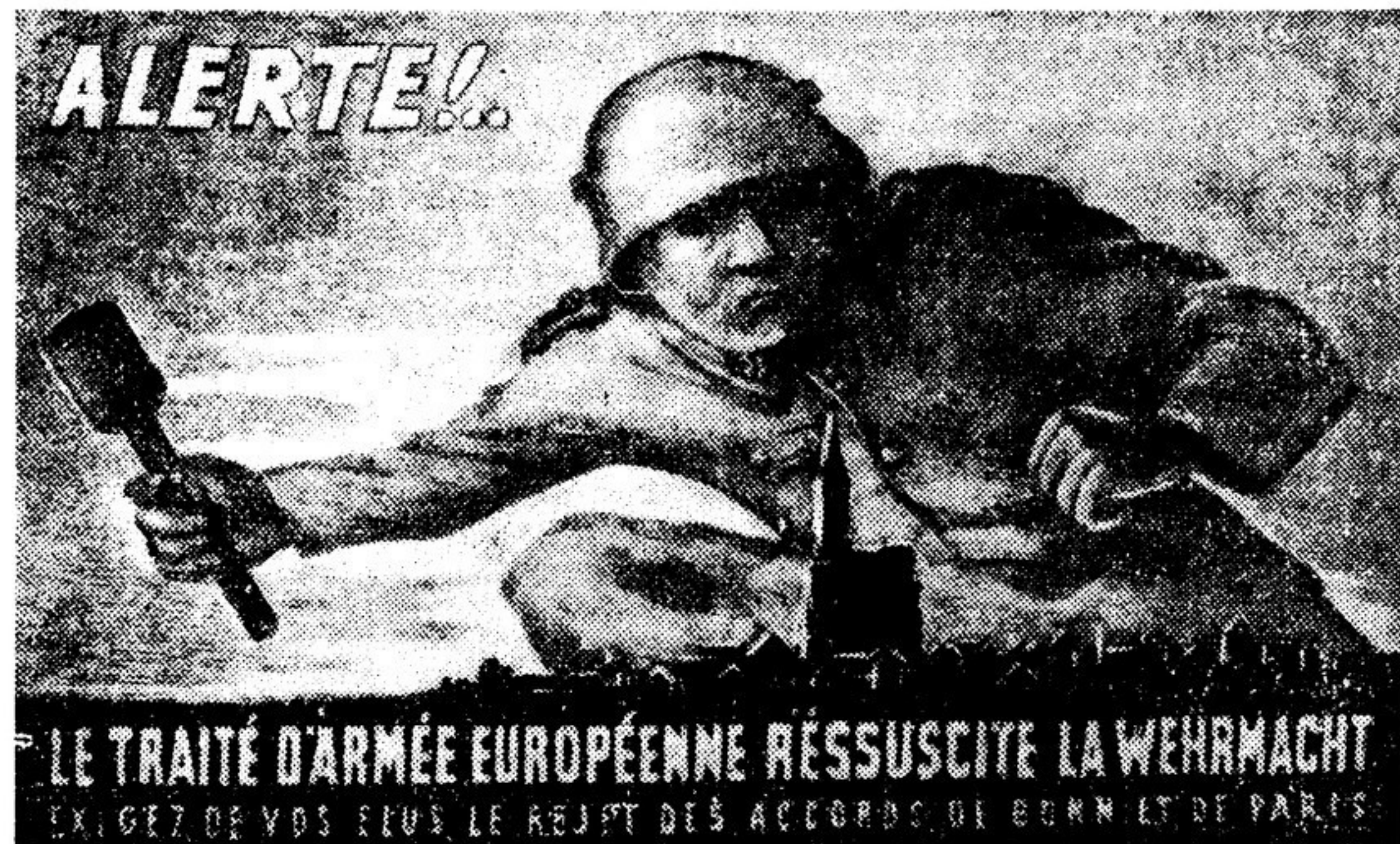
Плакат, распространяемый друзьями мира во всех уголках Франции. Надпись на нем гласит: «Тревога! Договор о европейской армии возрождает вермахт. Требуется от ваших депутатов, чтобы они отклонили боннский и парижский договоры!»

Яркое проявление единства народов Европы в борьбе против боннского и парижского договоров — конференция политических и общественных деятелей западноевропейских стран, созванная в Париже по инициативе группы депутатов французского парламента. В ней участвовало свыше ста представителей Франции, Англии,