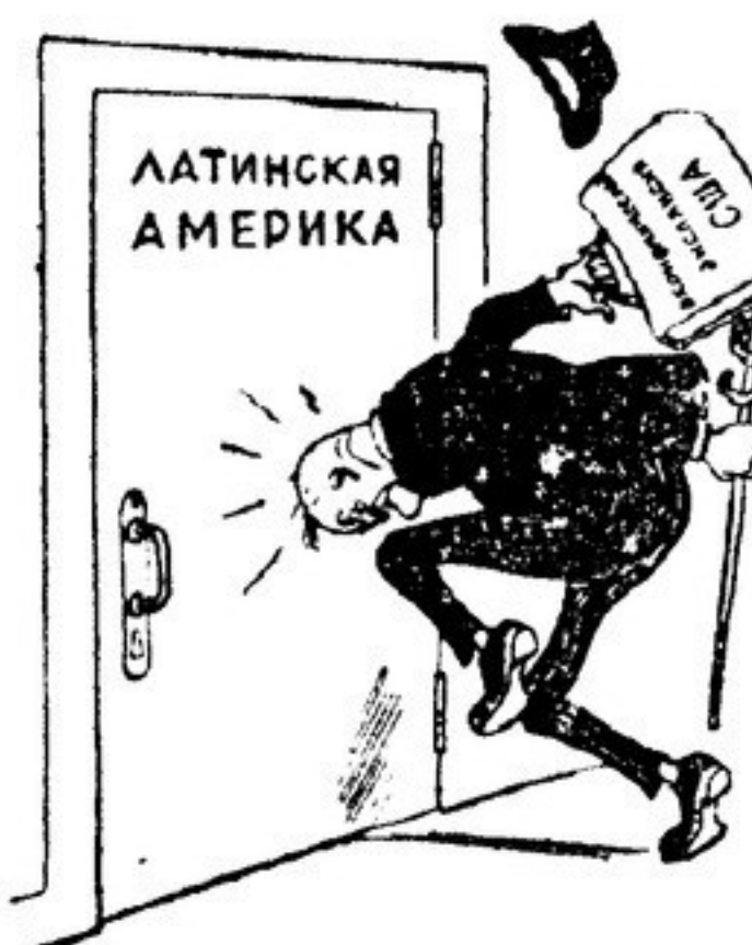
Рис. Бор. Ефимова

Х панамериканская конференция заканчивает свою работу. Ход нынешней конференции в Каракасе ясно показывает, что противоречия между США и латиноамериканскими «сестрами-республиками» заметно усилились и обострились, что экономическая экспансия американских монополий и диктаторские приемы американской дипломатии наталкиваются на все растущее сопротивление со стороны латиноамериканских стран.